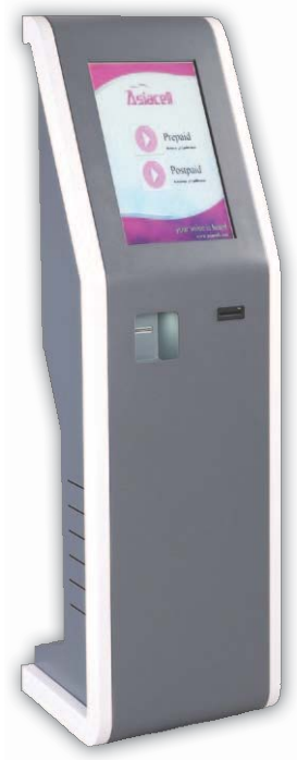
I-Box Kiosk (sivi)

PC, ekran osjetljiv na dodir, štampač, motorizovan čitač kartica (opcija) i operativni sistem. Štampa broj za red, odnosno broj klijenta te može štampati logo firme, datum i vreme na listiću.