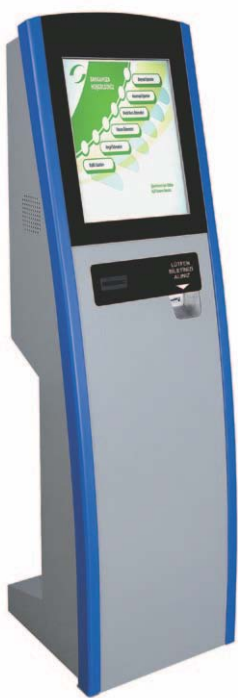
S-Box Kiosk (sivi ili beli)