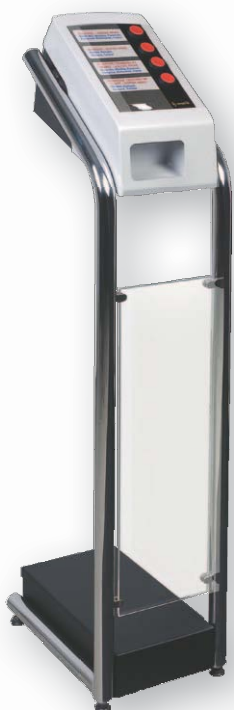
C-Box Samostojeći (sivi)

Štampači listića su idealni za male firme u potrazi za ekonomičnijim rešenjem.